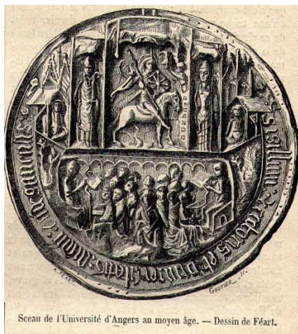
Seau de l'Université d'Angers au moyen âge. — Dessin de Féart.

L'Université d'Angers trouve son origine au XIe siècle, lorsque naquit le centre d'études supérieures appelé « Étude » ou « École » d'Angers. Elle prit le nom d'université ( studium ) en 1337; elle était la cinquième de France dans l'ordre de création (après Paris, Orléans, Toulouse et Montpellier). Au départ constitué de la seule Faculté de droit, l'établissement s'agrandit en 1432 avec la création des Facultés de médecine, arts et théologie. À la fin du XVe siècle, l'université comptait alors 1 000 étudiants.